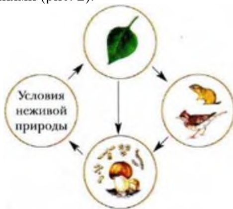
Рис. 2. Структура природного сообщества

В структуре природного сообщества различают четыре важных взаимодействующих между собой звена. Первое звено — неорганические вещества среды обитания и солнечная энергия. Второе звено — многочисленная группа различных зеленых растений (автотрофы), которые создают органические вещества и запасают в них энергию. Третье звено — гетеротрофы (животные и грибы), которые потребляют созданные растениями органические вещества и энергию. Четвертое звено — тоже гетеротрофы (это бактерии, грибы, животные), но они разлагают мертвые органические вещества до неорганических веществ (соли, углекислый газ, вода), возвращают их снова в окружающую среду, где они вновь могут поглощаться зелеными растениями (рис. 2).