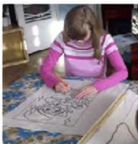
Перенесение идеи на ткань

Цель выполнения задания: продолжать осваивать технологию выполнения гобелена.