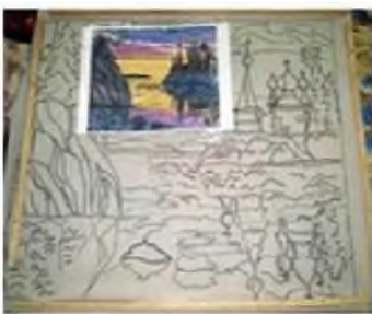
Рисунок по базовому материалу