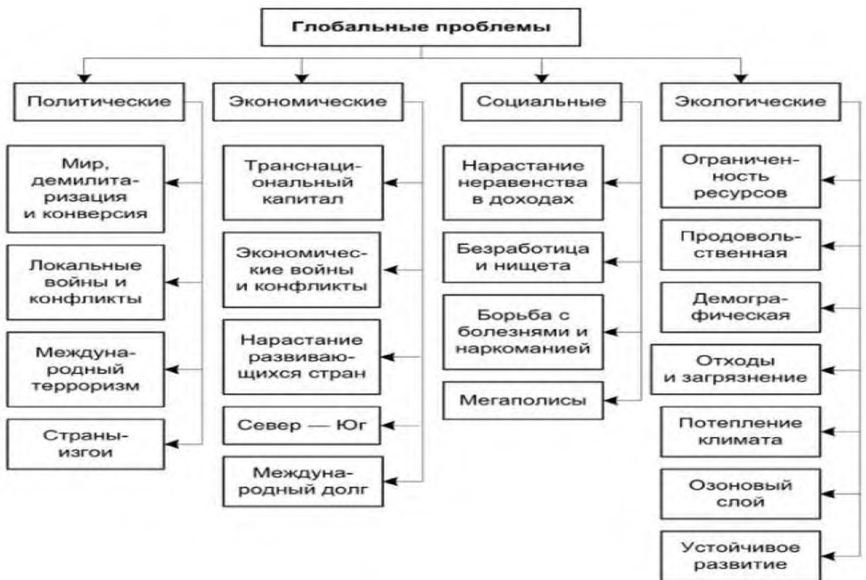
Рисунок 1 — Классификация глобальных проблем

Используя текст учебника, справочную и дополнительную литературу, интернет-ресурсы и предложенный план, дайте описание одной из глобальных проблем человечества (по выбору учащегося):