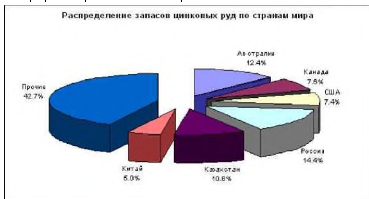
Распределение запасов цинковых руд по странам мира