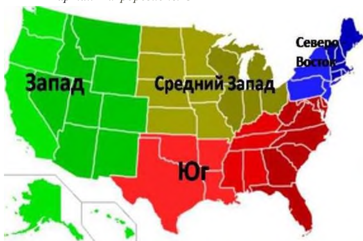
Карта.. Макрорегионы США