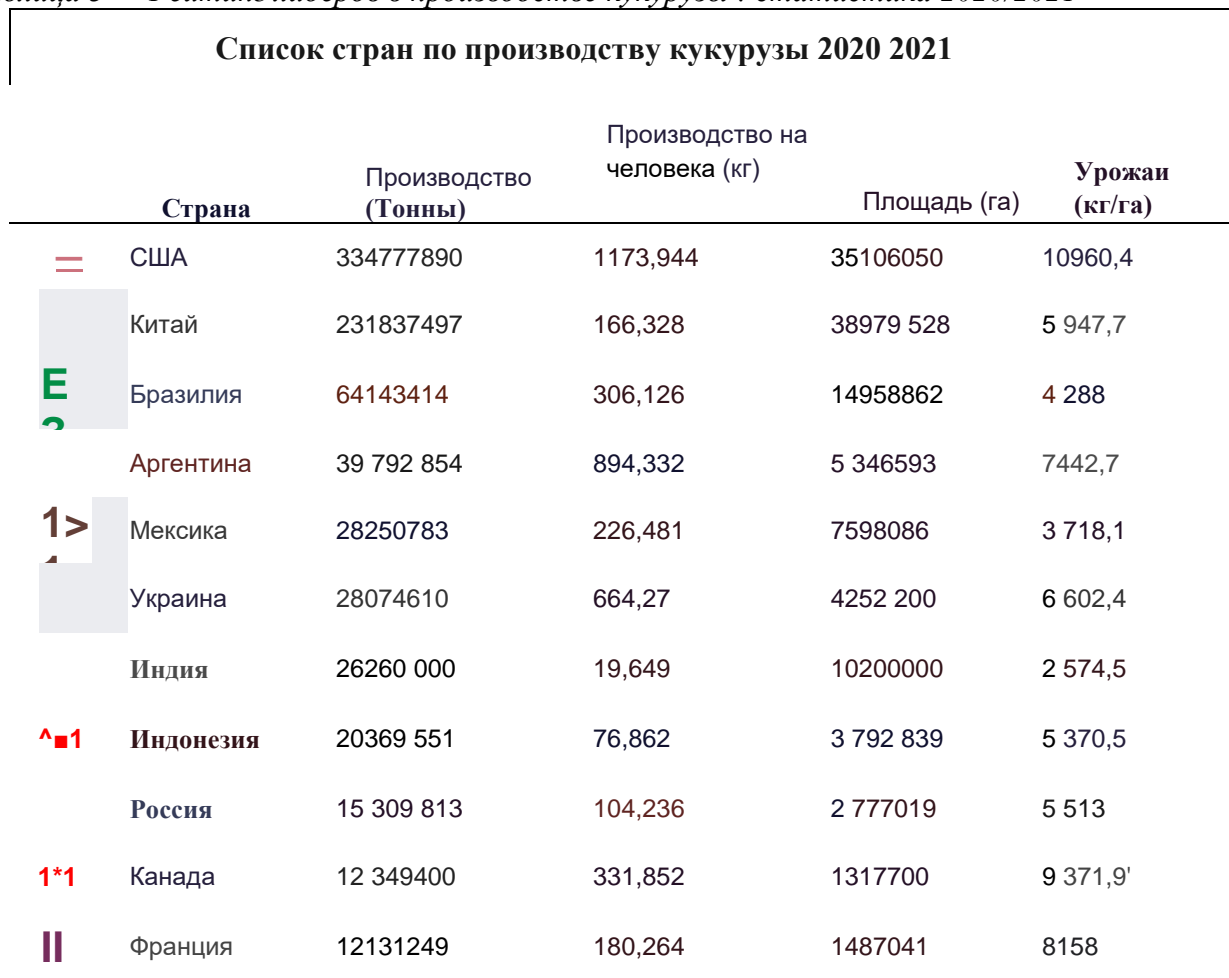
Таблица 3 — Рейтинг лидеров в производстве кукурузы : статистика 2020/2021