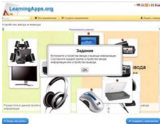
Рис. 8. Просмотр задания

12. Ученик, прочитав задание, классифицирует устройства ввода и вывода в две колонки.