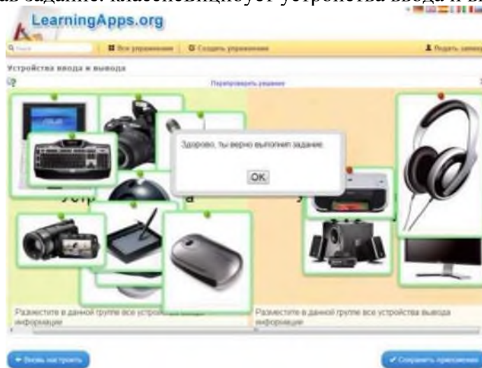
Рис. 9. Проверка задания

12. Ученик, прочитав задание, классифицирует устройства ввода и вывода в две колонки.