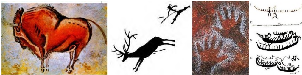
№1 №2 №3 №4

Искусство неолита. V-III тыс. до н.э. _____