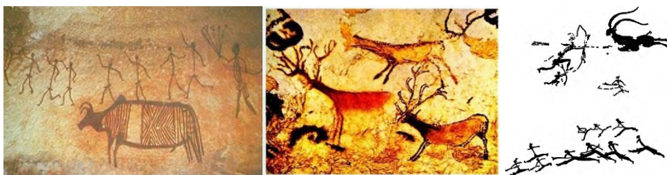
№5 №6 №7