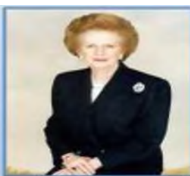
Великобритания Маргарет Тэтчер (>979—>99°)