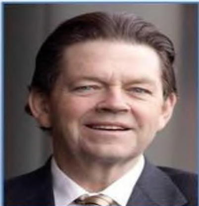
Фридрих фон Хайек Артур Лаффер

А. Лаффер - американский экономист, представитель Ф. фон Хайек - австрийской школы экономики, ориентированной на предложение. Знаменит благодаря открытию эффекта Лаффера - в определенных условиях либерализма и свободного рынка. Выдвинул теорию, что может вызвать увеличение налоговой самоорганизации как главного вектора развития, что ведет к увеличению вложений в производство и его обновления.