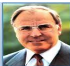
ФРГ Гельмут Коль (—1908)