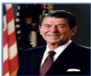
США Рональд Рейган (1981—1989)

Приход к власти неоконсерваторов в 1980-е гг.