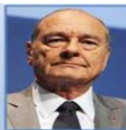
Франция Ж. Ширак (1986—1988)

В 1979 году Маргарет Тэтчер так описала цели своей политики: «Я пришла к власти с одним чётким намерением - изменить Британию. Превратить её из иждивенческого общества в самостоятельное, из страны, сидящей и ожидающей неизвестно чего, в страну энергично действующих людей.