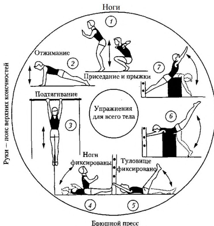
Метод круговой тренировки

Круговой метод представляет собой последовательное выполнение специально подобранных физических упражнений, воздействующих на различные мышечные группы и функциональные системы. Для каждого упражнения определяется место или «станция».